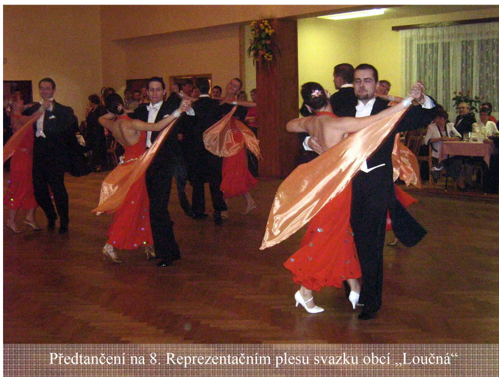
Předtančení na 8. Reprezentačním plesu svazku obcí „Loučná“