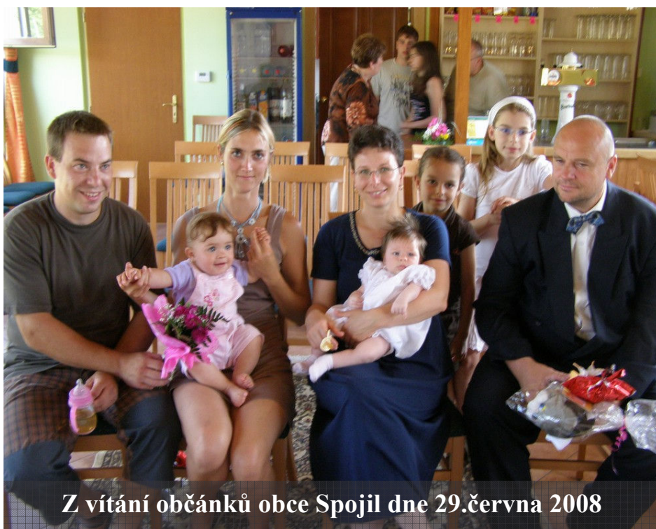
Z vítání občánků obce Spojil dne 29.června 2008