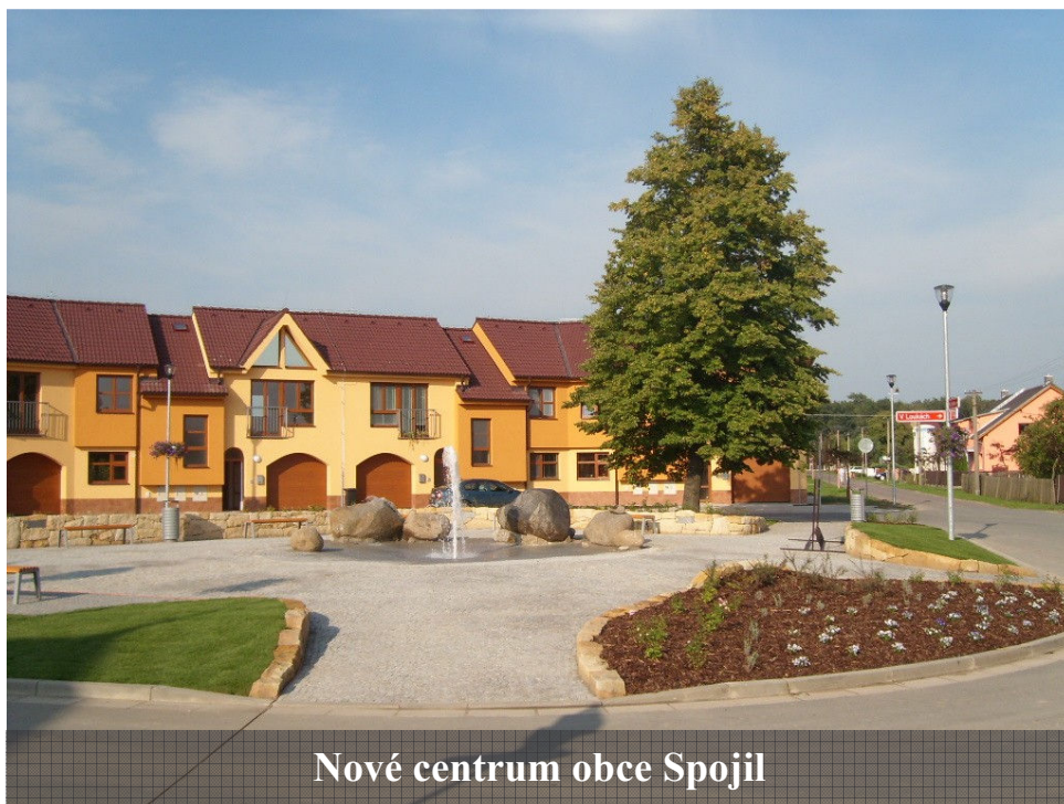
Nové centrum obce Spojil

, „ aneb co jsme slyšeli, povídáme dál “