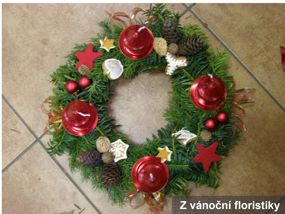
Z vánoční floristiky