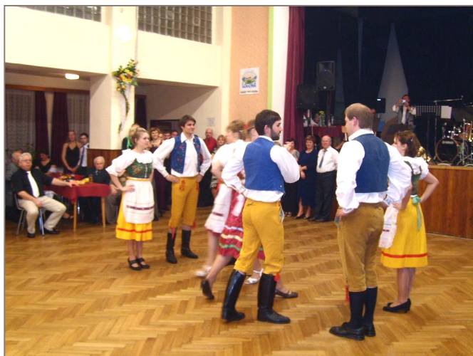
Česká beseda .

Nebyl by to řádný ples, kdyby chybělo předtančení. V první části plesu vystoupila se svým moderním tancem místní dívčí skupina Malinky. O něco později potěšil především starší část návštěvníků domácí taneční soubor tancem