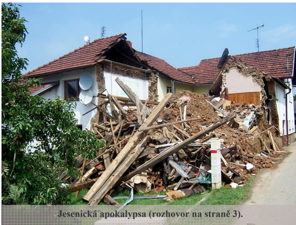
Jesenická apokalypsa (rozhovor na straně 3).

, „ aneb co jsme slyšeli, povídáme dál “