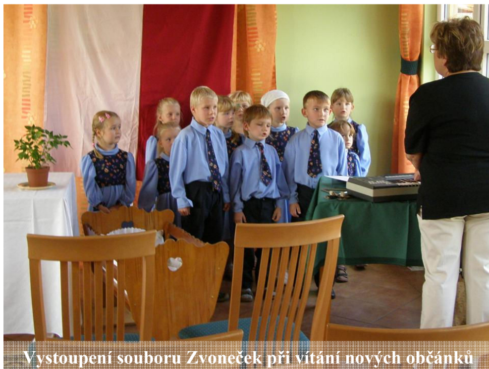
Vystoupení souboru Zvoneček při vítání nových občánků

, „ aneb co jsme slyšeli, povídáme dál “