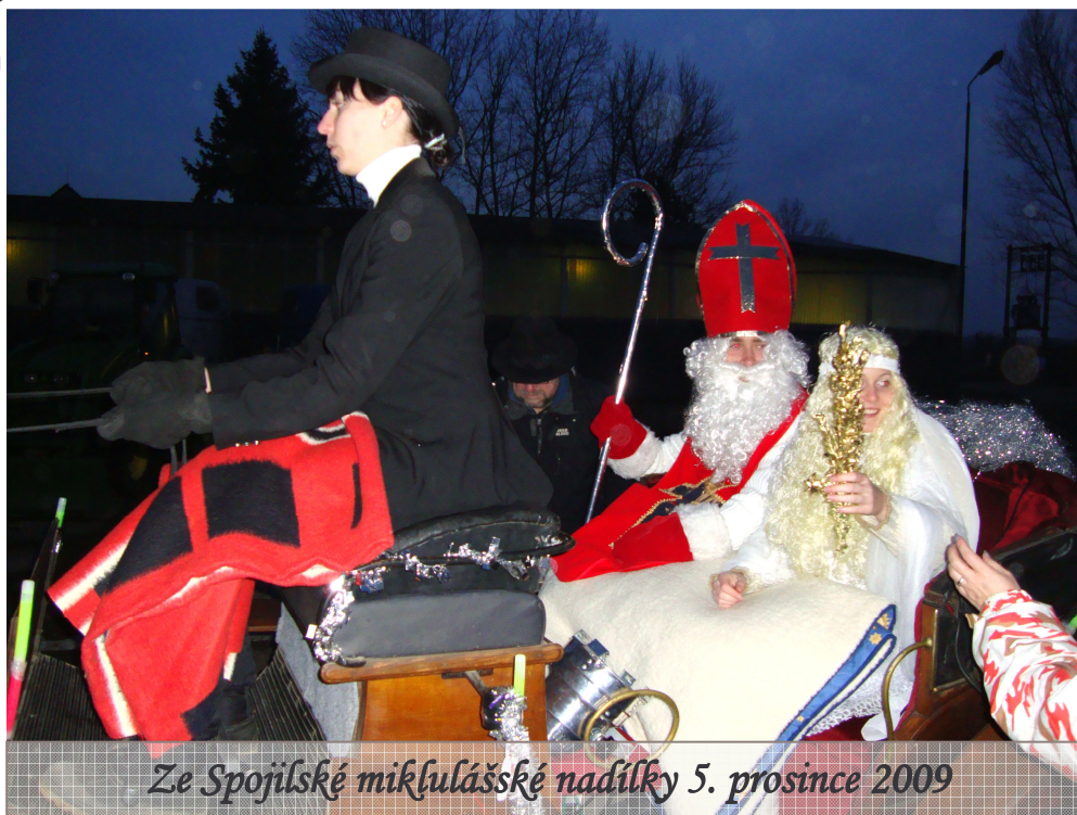
Ze Spojilské mikulášské nadílky 5. prosince 2009

, „ aneb co jsme slyšeli, povídáme dál “