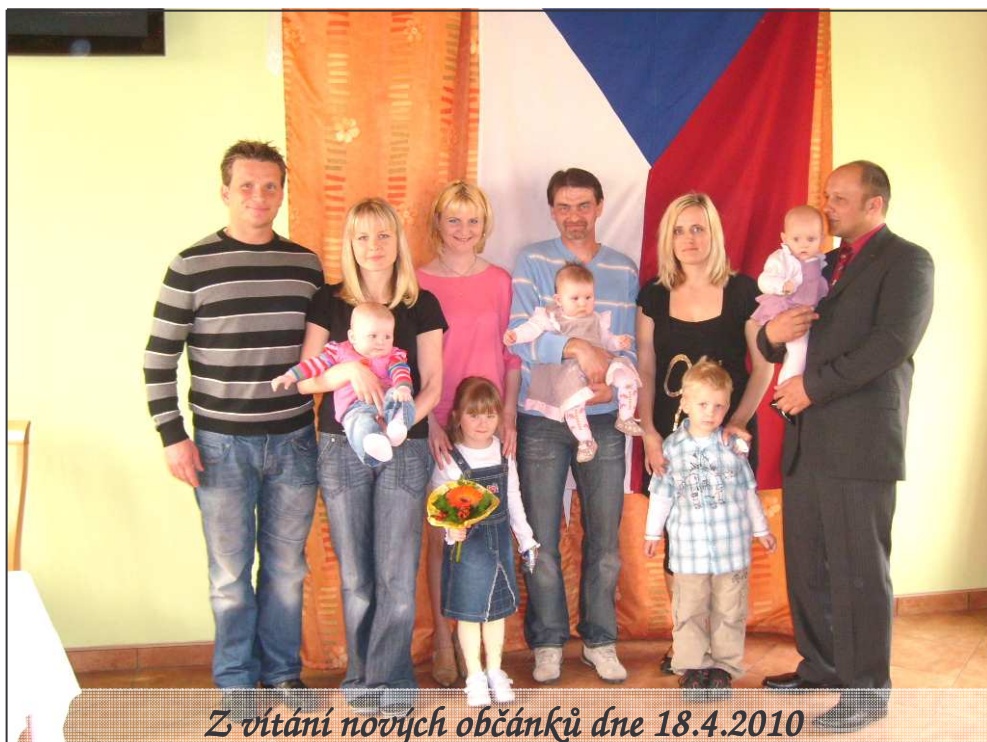
Z vítání nových občanů dne 18.4.2010

, „ aneb co jsme slyšeli, povídáme dál “