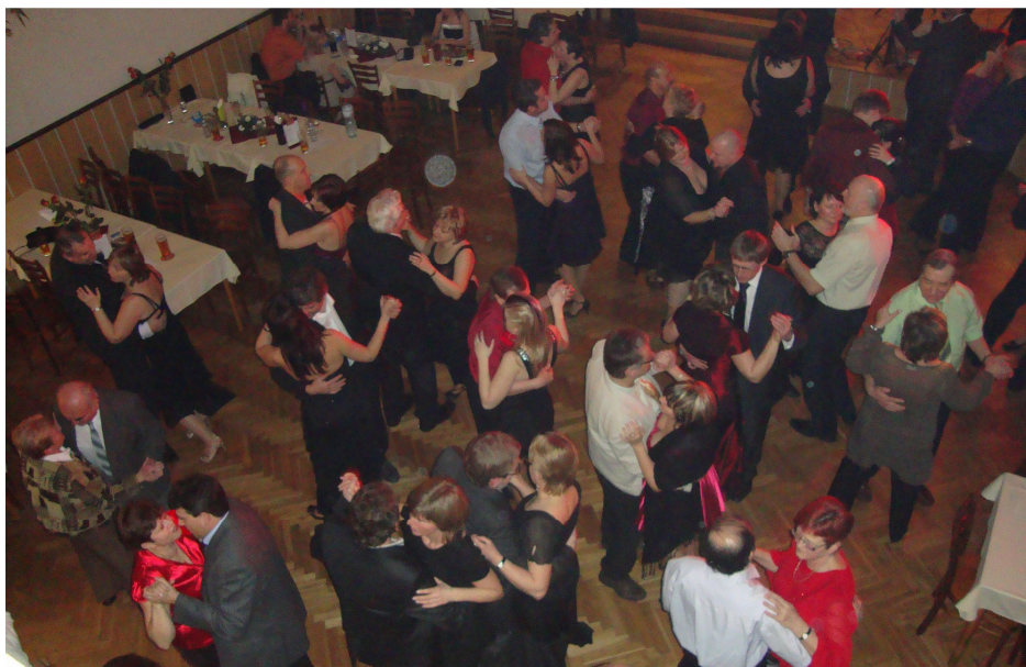
3. reprezentační ples obce Spojil a SDH obce Spojil

, „ aneb co jsme slyšeli, povídáme dál “