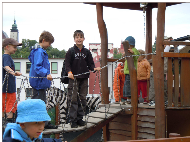
Než se všichni nadáli, ocitli se před

Sobotní ráno 18. června nás nepřivítalo zrovna přívětivě. Ač bylo poměrně teplo, dívala se na nás pomračená obloha, která nedávala příliš nadějí na pěkný slunný den. To však neodradilo 52 spojilských občanů a jejich dětí zúčastnit se zájezdu do zoologické zahrady Jihlava. Konečně nastal tak toužebně očekávaný den. Přesně podle pokynů organizátorů se od tři čtvrtě na osm ráno začaly scházet naše ratolesti v doprovodu svých rodičů před obecním úřadem. Ač je to naprosto ojedinělé a v naší obci unikátní, světe div se!!!, přesně v osm hodin, jak velel plán, bylo všech 27 spojilských dětí s rodičovským doprovodem na svých místech v autobuse. Ted nezbývalo nic jiného, než zamávat, popřát šťastnou cestu a hodně pěkných zážitků od místostarostky obce. Zavřít dveře a huráá!!! Plně obsazený autobus se vydal na téměř sto kilometrovou cestu směr Jihlava.