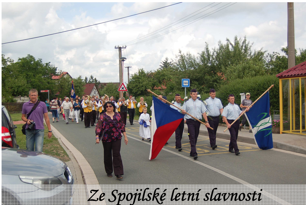
Ze Svojilské letní slavnosti