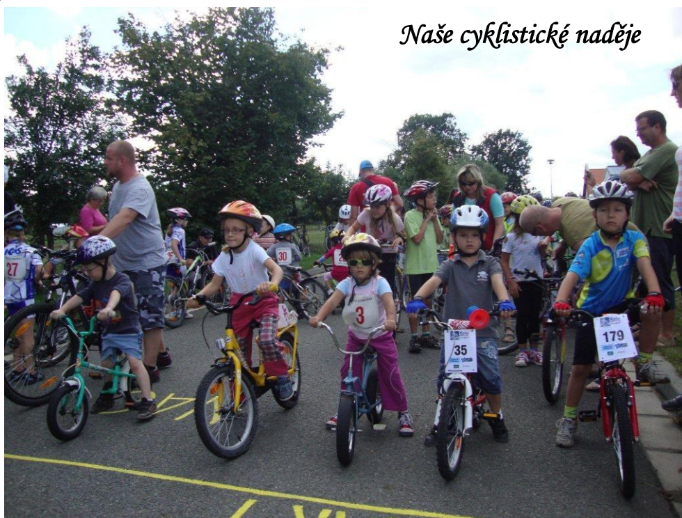
Naše cyklistické naděje

, „ aneb co jsme slyšeli, povídáme dál “