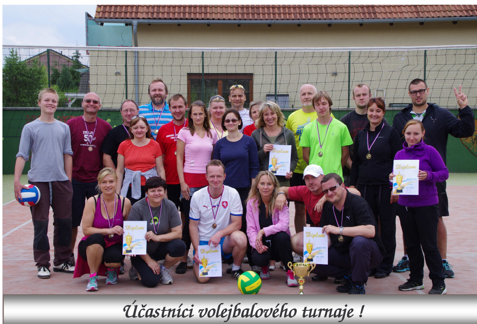
Účastníci volejbalového turnaje !

, „ aneb co jsme slyšeli, povídáme dál “