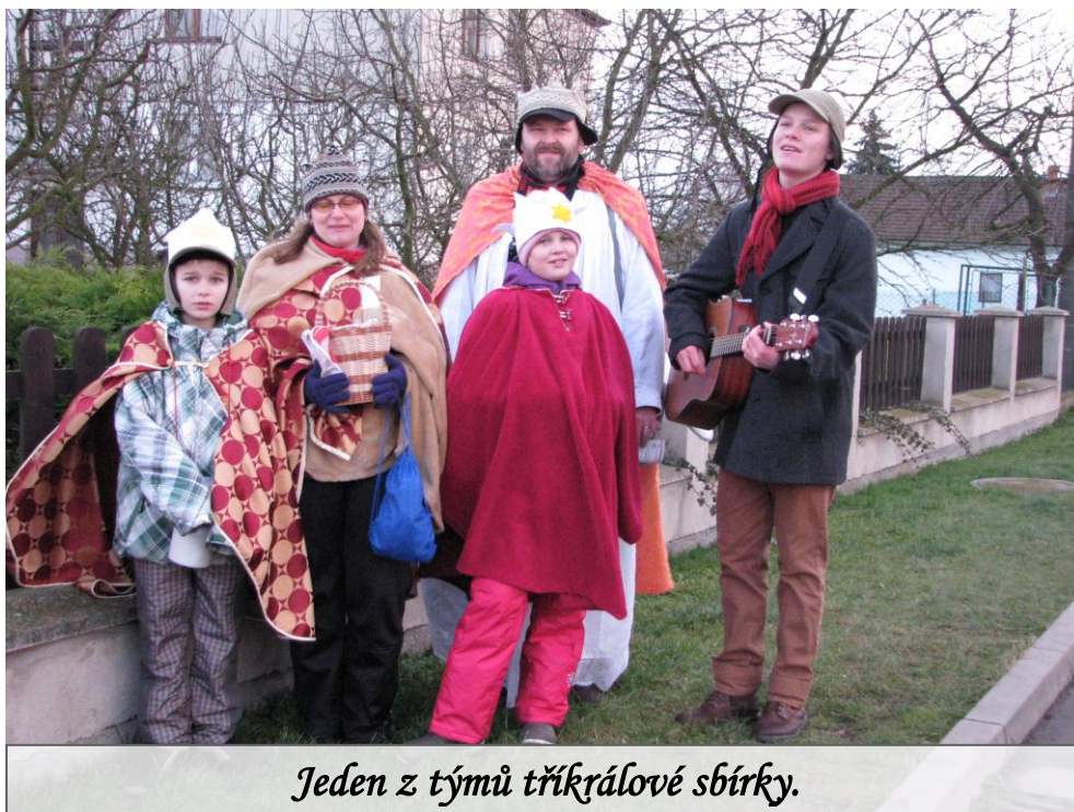
Jeden z týmů tříkrálové sbírky.