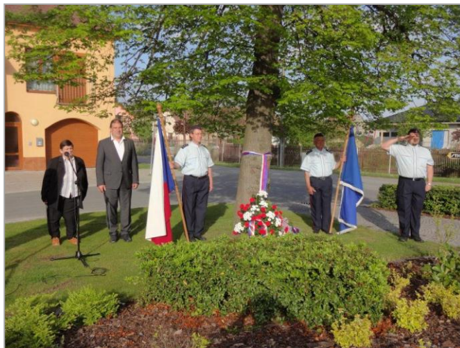
staré události, zástupci vedení obce a SDH obce Spojil položili kytici k naší Lípě Svobody.

Po celé naší vlasti, stejně jako i v okolním světě probíhaly na počátku května 2015 pietní akty a oslavy směřované k 70. výročí ukončení nejstrašnější války v dějinách lidstva. Ani naše obec Spojil nezůstala pozadu a v podvečerních hodinách 8. května se na spojilské návsi konal pietní akt za účasti vedení obce a Sboru dobrovolných hasičů. Bohužel se nás k tomuto uctění památky obětí druhé světové války sešla pouze nepočetná skupina, možná i z důvodu prodlouženého víkendu. Domnívám se, že na všechny přítomné velmi zapůsobila emotivní slova pronesená paní starostkou. A i když nikdo z nás přítomných hrůzy války nezažil, jistě jsme si v této chvíli zcela jasně uvědomili, že něco podobného zažít nechceme a že musíme dělat vše pro to, aby taková situace již nikdy nevznikla. Po proslovech, jako úctu a vzpomínku na sedmdesát let