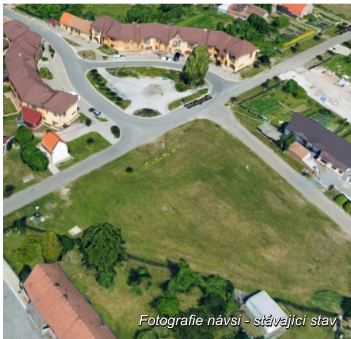
Fotografie návsi - stávající stav

Řešené pozemky plynule navazují na novou náves, která byla vybudována v roce 2008.