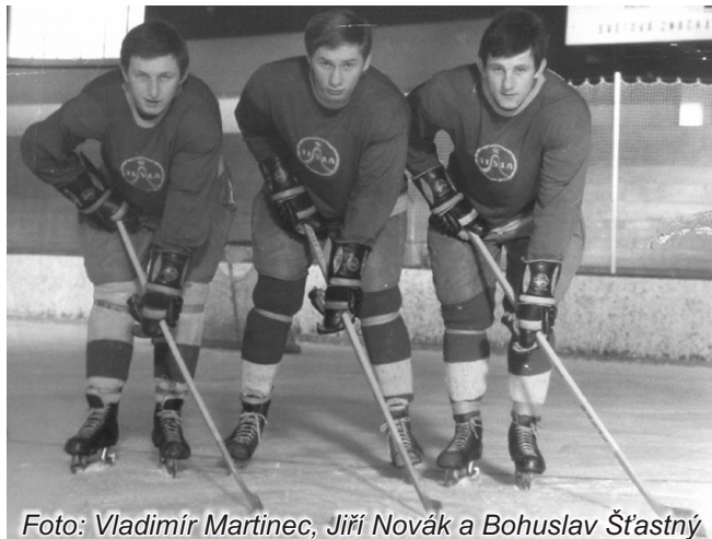
Foto: Vladimír Martinec, Jiří Novák a Bohuslav Šťastný

Jiří Novák oslavil 6. června svoje 70. narozeniny a i přes to, že byl za svou dlouholetou kariéru v hokeji několikrát těžce zraněn, nechybí mu ani dnes smysl pro humor i báječná fyzika, kterou utužuje oblíbeným golfem.