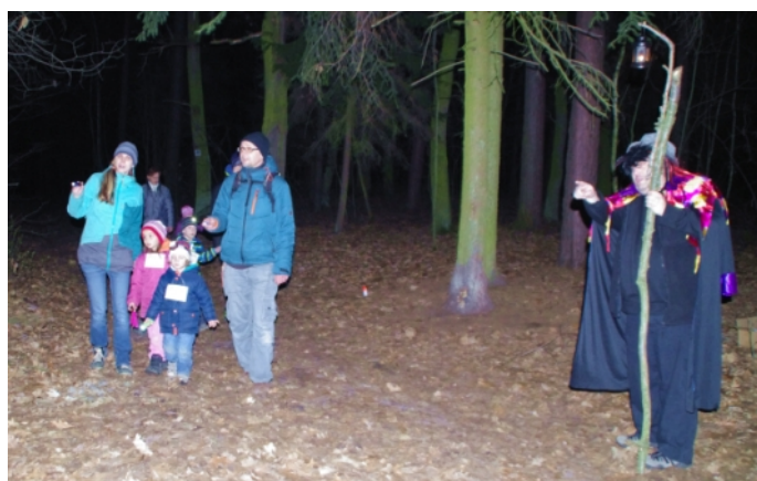
Dětský karneval a dobrodružná Spojilská noční výprava. Velmi nás mrzí, že se plánované akce nemohly uskutečnit a těšíme se na dobu, kdy se budeme moci zase vídat, společně se bavit a radovat a všechny zmeškané akce nějak vynahradit především našim nejmenším...