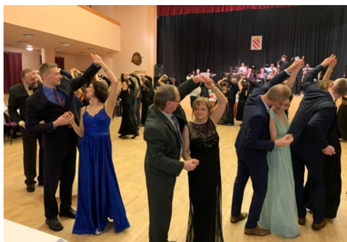
Mazurka doma v obývací. Vzpomínka na loňský obecní ples. Oblíbená mazurka, která je natolik společenská a kontaktní, že by mohla reprezentovat všechny platné zákazy a kdo ví, zda si ji ještě někdy zatančíme. Ale co, hezky se obléknout, rozdělat dobré víno a zatančit si ve dvou můžeme i doma. Možná to bude příjemná změna, netradičně prožitý večer, malý soukromý ples.