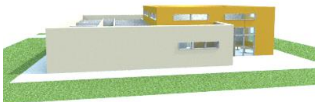
Pohled od východu (od multifunkčního hřiště):