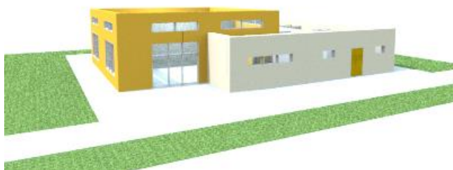
Pohled ze severu (ulice U Lesa):